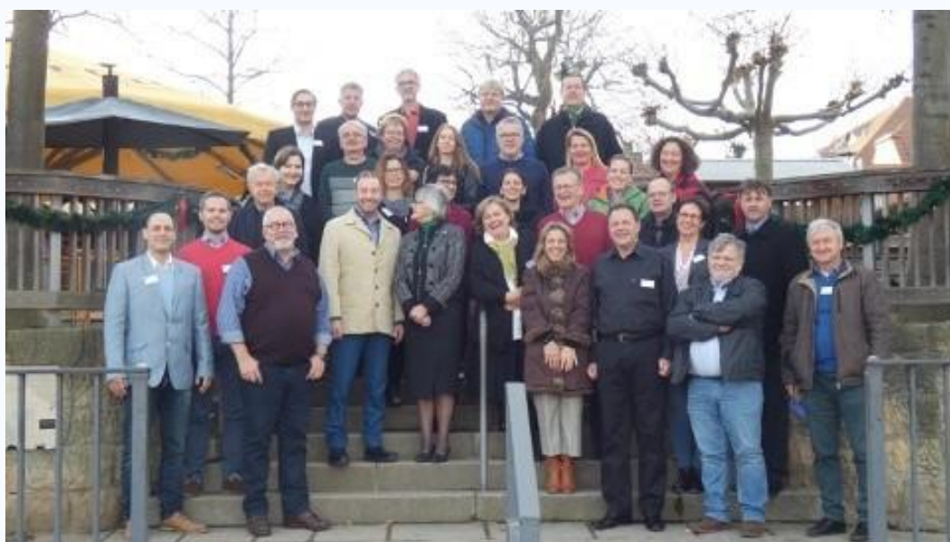
Kick-off møde i Dresden 16.-18. december 2019

Implementering af en høj kvalitetsstandard med hensyn til kvalifikationstilbud er formuleret i specifikke skolebestemmelser, hvis overholdelse overvåges af et ekspertudvalg fra paraplyorganisationen UNIEP. Det siger sig selv, at alle relevante nationale bestemmelser overvåges og overholdes.